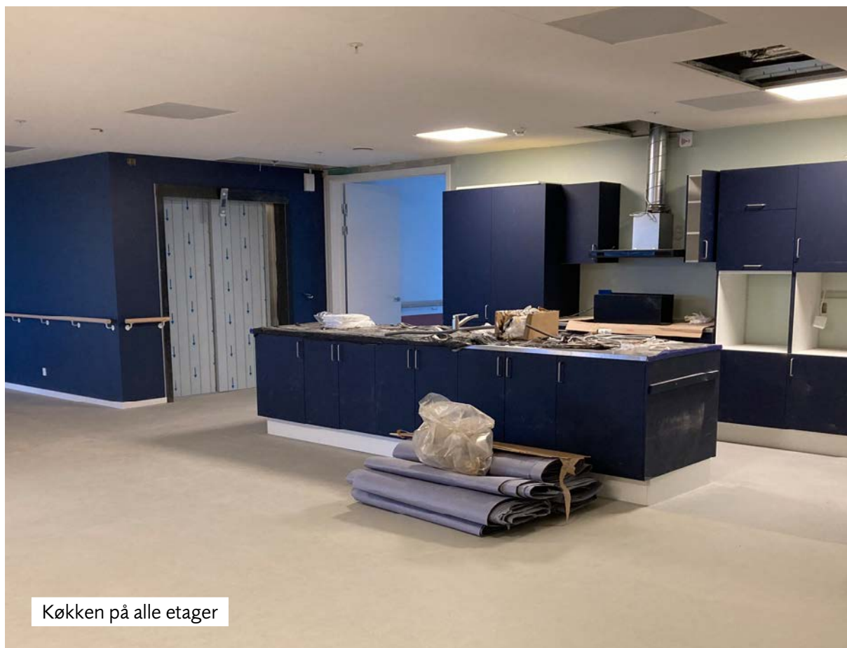
Køkken på alle etager