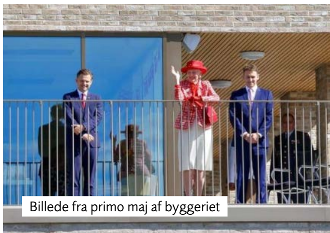
Billede fra primo maj af byggeriet

Primo 2023 når alle beboere er flyttet fra gammelt til nyt, skal den gamle Ingeborggården nedrives.